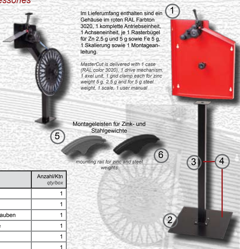
Montageleisten für Zink- und Stahlgewichte

MasterCut is delivered with 1 case (RAL color 3020), 1 drive mechanism, 1 axel unit, 1 grid clamp each for zinc weight 5 g, 2,5 g and for 5 g steel weight, 1 scale, 1 user manual